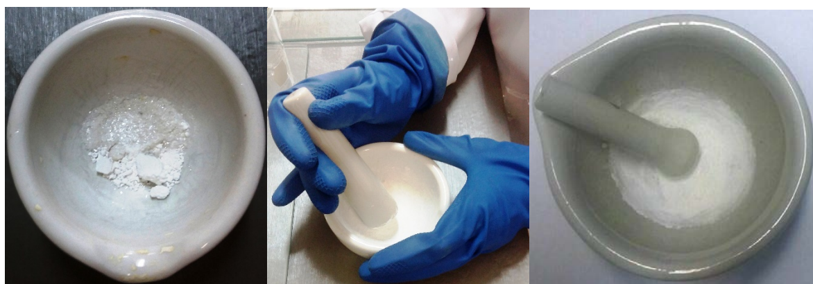
Figura 2S. Fotos da sequência da reação mecanoquímica de cloração da acetanilida com o ATCl por moagem manual (da esquerda para direita): reagentes no gral; durante a moagem; após moagem