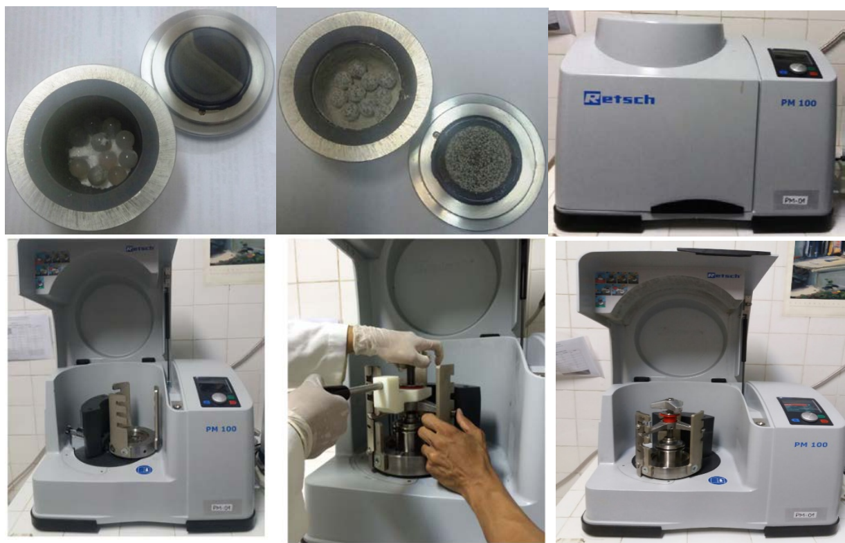
Figura 3S. Fotos da sequência da reação mecanoquímica de cloração da acetanilida com o ATCI no moinho de bolas planetário, primeira linha (da esquerda para direita): reagentes no reator de ágata com esferas de ágata; mistura reacional após moagem; moinho com a tampa fechada; segunda linha (da esquerda para direita): moinho com a tampa aberta; encaixe do reator com a mistura dos reagentes