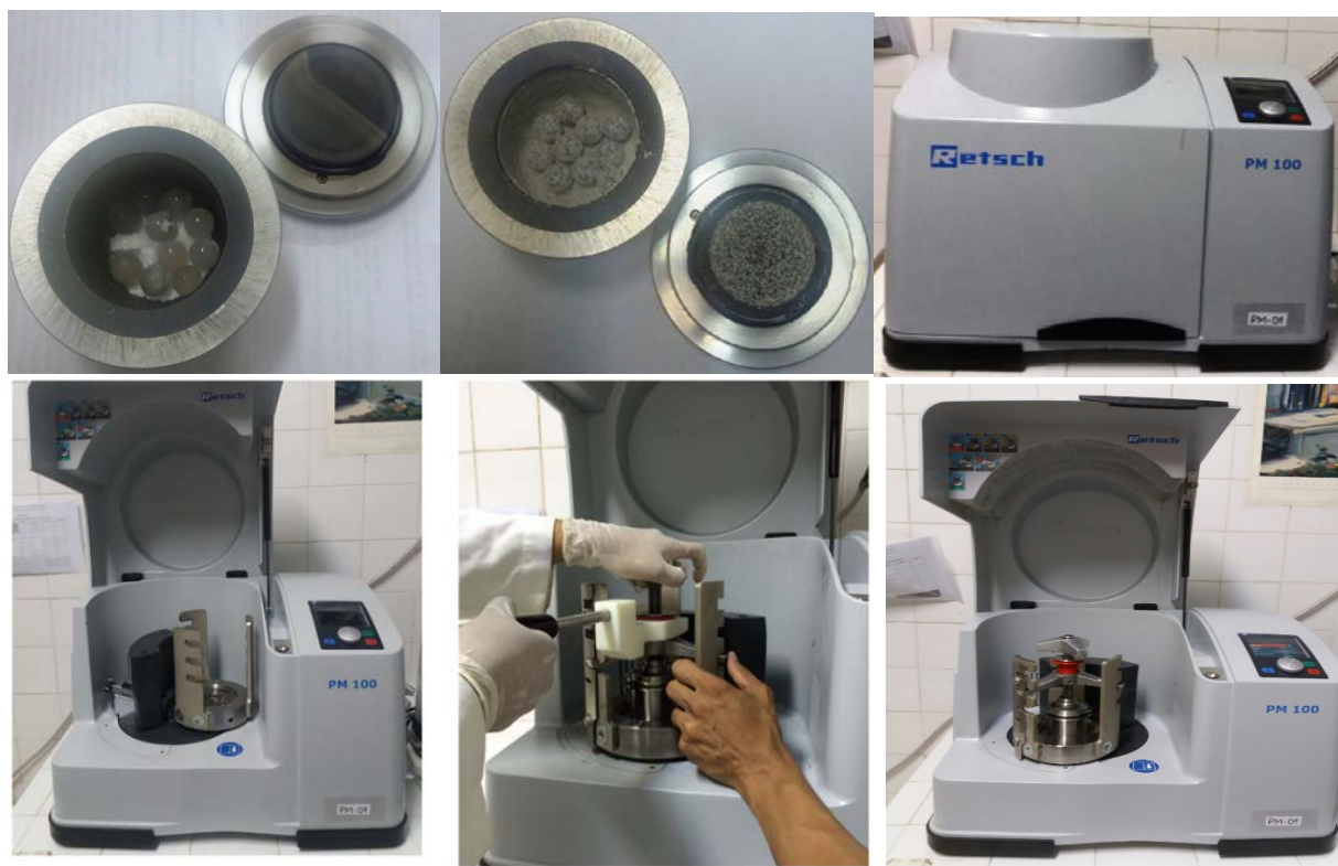
Figura 3S. Fotos da sequência da reação mecanoquímica de cloração da acetanilida com o ATCI no moinho de bolas planetário, primeira linha (da esquerda para direita): reagentes no reator de ágata com esferas de ágata; mistura reacional após moagem; moinho com a tampa fechada; segunda linha (da esquerda para direita): moinho com a tampa aberta; encaixe do reator com a mistura dos reagentes